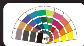
Autres couleurs RAL sur demande