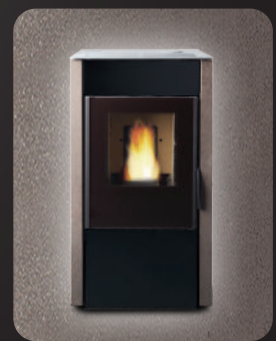
Pierre de Volvic