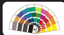
Autres couleurs RAL sur demande